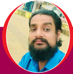
चित्रांश एक्सप्रेस डॉट इन