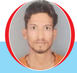
चित्रांश एक्सप्रेस डॉट इन कहां गई हमारी भारतीय संस्कृति

बहन तेरे खुलें तन से,तेरी पुरखे भी शरमाये, तेरी नगनता देखी तो,तेरी माँ के नैन भर आये । सिर्फ पैसों के खातिर,उघाडो मत अपना बदन, हवस उन धन कुबेरों की,तुम्हें बे घर न कर जाए ।