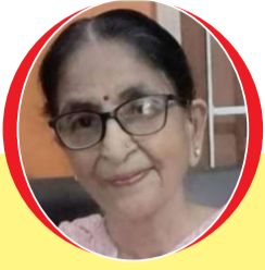
चित्रांश एक्सप्रेस डॉट इन फागुन आया

शीत हरण कर लेगया मधुमास, आ गया रंगीला फागुन मास । फागुन की बयार मस्तानी, रंगों की है ऋतु दीवानी ।