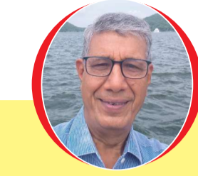
चित्रांश एक्सप्रेस डॉट इन

सबकी तो ये धरती अपनी सबका जीवन प्यारा यारो । एक बात मैं कहता दिल से, कभी किसी का हक मत मारो ॥