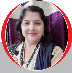
चित्रांश एक्सप्रेस डॉट इन हो जाता है प्यार

जब किसी की बातें.....दिल को गुदगुदाती हैं तन्हाई में बैठ कर भी ... याद उसी की आती है