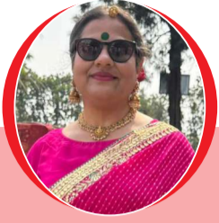
चित्रांश एक्सप्रेस डॉट इन