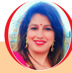
चित्रांश एक्सप्रेस डॉट इन