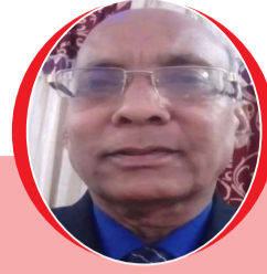
चित्रांश एक्सप्रेस डॉट इन स्नेह से भीगी तुम्हारी छुअन.....!!

मधुर प्रेम की सांकल बजने लगी हृदय द्वार पर नजरें टिकी हुई हैं तुम्हारे मौन हुए भाव पर ।।