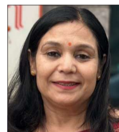
चित्रांश एक्सप्रेस डॉट इन