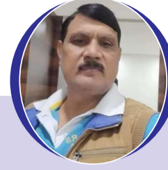
चित्रांश एक्सप्रेस डॉट इन

अगर इश्क में तेरे बेखौफ ना होती, तो हर जगह तस्वीर तेरी नजर न आती। अगर मोहब्बत मेरी बेखौफ न होती, तो तुझसे जुदा होने के डर से मर जाती।