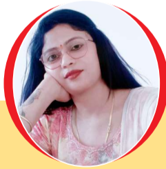
चित्रांश एक्सप्रेस डॉट इन