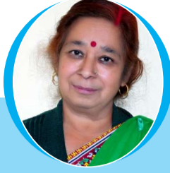
चित्रांश एक्सप्रेस डॉट इन