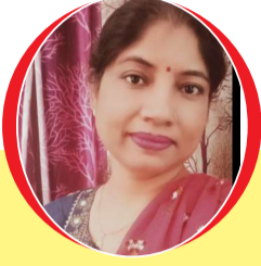
चित्रांश एक्सप्रेस डॉट इन