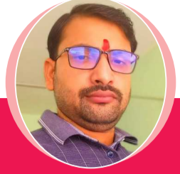
चित्रांश एक्सप्रेस डॉट इन