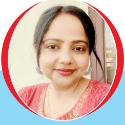
चित्रांश एक्सप्रेस डॉट इन

जो न आओ तो अपनी तस्वीर भेज देना, शायरी में झूठे इश्क की तहरीर भेज देना।