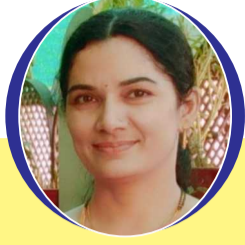
चित्रांश एक्सप्रेस डॉट इन