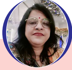
चित्रांश एक्सप्रेस डॉट इन

बाँटते रहो मधुर मुस्कान क्या रक्खा तेरा - मेरा में, बाँटते रहो मधुर मुस्कान। पल दो पल की जिंदगानी है, यही है जीवन की पहचान। झंझावात को छोड़कर लाओ, सबके लबों पर तुम मुस्कान। जीवन का हर दुख सह जाता, सुगमता से सच्चा इंसान। यूँ तो हमारे जीवन में, संकट का भी आता है तूफान। लेकिन साहस, धैर्य रखकर, क्षणभंगुर का है भान। गमों में भी जो हंसकर जीता, इसी को कहते, जीने का नाम। जीवन का चक्र चलता है यूँ ही, मायूस न हो तुम यूँ इंसान। दूजे के दुख को.. जो अपना समझे, बहती दिल में प्रेम की धार। राग, द्वेष तनिक न रखता, उसका जीवन होता गुलज़ार। जब तक सूरज चाँद रहेगा, दुख सुख का होता रहेगा भान। अपनी प्यारी मीठी बातों से, बाँटते रहो मधुर मुस्कान।