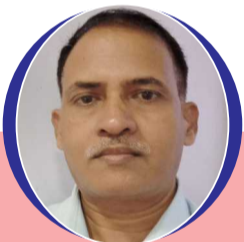
चित्रांश एक्सप्रेस डॉट इन