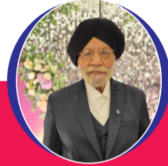
चित्रांश एक्सप्रेस डॉट इन

घाव गहरे थे बहुत समझाना तुम्हें जरूर था ठिकाना मेरा जब था ही नहीं तो दर दर ठोकरें खाना भी जरूरी था हम जैसे महारूमों का भी गुजारा आसान कहां करके गुजारिश तुमसे हमें बार बार ये सच कहना भी जरूरी था हुई चाहतें नाकाम फिर भी सब्र हम करते रहे बढ़ा कर मायूसी अपनी बार बार अर्ज तुमसे करना भी जरूरी था परख के अंदाज़ ए बेरुखी तेरा जला कर चिराग दिल में बुझाए बार बार बात दिल की तुमसे कहना भी जरूरी था करके गुजारा किसी तरह दिल को समझाए बार बार वफा की राह में बढ़ा कर दर्द तुम्हें आजमाना भी जरूरी था