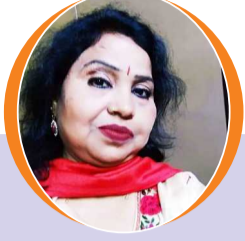
चित्रांश एक्सप्रेस डॉट इन

ये मुस्कुराहट तुम्हारे चेहरे पर बनी रहे सच, मुस्कुराता हुआ चेहरा कौन नहीं चाहता चेहरे की मुस्कान जिंदगी की लय बदल देती है मुस्कुराहट ही है जिससे चेहरे का नूर बदल देती है यह जिंदगी एक रंगमंच की तरह है जिस रंगमंच पर इंसान हंसता है मुस्कुराता है तो कभी रोता भी है अगर चेहरे पर मुस्कान हो और चेहरा तनाव मुक्त हो ऐसे चेहरे पर क्यों ना कोई निसार हो मुस्कान इंसान की जीवन की सफलता का कुंजी है चेहरे की मुस्कुराहट दामन में खुशियां भर देती हैं मुस्कुराहट चेहरे की नजाकत भी होती है ऐसे में हर इंसान को हर पल मुस्कुराने का बहाना ढूंढना चाहिए क्योंकि मुस्कुराहट में छुपी है जीवन की कश्ती तभी वह जीवन रूपी नैया को पार कर सकता है यह कोई दौलत नहीं जो कोई हमसे छिन सके ना ही कोई जायदाद है जो कोई बांट सके मुस्कुराने के लिए कंजूसी कैसी जिंदगी जीने में रुकावट कैसी मुस्कुराहट पूरे दिन को हसीन बना देती है ख्वाबों को हकीकत बना देती है अगर हो जिंदगी को खुशनुमा बनाने की चाहत तो अपने चेहरे पर मुस्कुराहट देगी जिंदगी में राहत चेहरे की मुस्कान ,चेहरे का सुरूर इंसान के दामन में खुशियां भर देती हैं