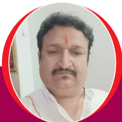
चित्रांश एक्सप्रेस डॉट इन

मौन रहोगे तुम अगर, दिल को आए चैन। दिन होगा मधुमास सा, शालीन होगी रैन।। साँझ ढली सूरज थका, बाकी फिर भी काम। उसके बिन चलती नहीं, रजनीकर की धाम।। दर्पण में श्रृंगार कर, जब मुस्काती नार। अच्छे अच्छे सूरमा, बन जाते बेकार।। वह साया किस काम का, जो छिने अधिकार। इससे अच्छा तो भला, कर लो रब से प्यार।। तारों से कर मित्रता, चाँद कहे हम साथ। लेकिन देखे चाँदनी, पकड़े उसका हाथ।। प्रियतम को खत भेजकर, पूछा उनका हाल। उत्तर में रखड़ी मिली, और कँगन की थाल।।