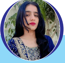
चित्रांश एक्सप्रेस डॉट इन

आसमान साफ है। तपी तेज धूप, बझलों में छड़ी उमस हैं। तन से छूटा पसीना टप - टप, पत्तों में छाया सन्नाटा हैं। आज बादल उभर आए, उमस फूट पड़ी बूंदें बनकर। जी भर बरसे बादल, फूट फूट के रोयें हैं। अब आसमान साफ हैं। संध्या का हुआ समय गोरी गोरी मिट्टी, अब साफ हुआ आसमान। तपा सूरज ढल रहा हैं। आसमान में छड़ी, लाल - लाल लालिमा। बादलों में तपा लावा आज ठंडा हो गया, लाल - लाल आसमान पर ठंडी - ठंडी नमू हवा, आग जैसे आसमान में, ठंडी और नमी छड़ी हैं। उमस से भरे बादल फूट फूट के रोयें हैं। बादलों में भरा उमस, पानी की बूंदें बनकर बरस गया, अब आसमान साफ हैं।