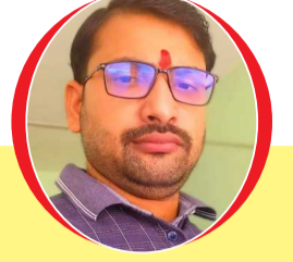
चित्रांश एक्सप्रेस डॉट इन

कविता आती है नहीं, बनते हैं कविराज। ऐसे कवियों से भरा, आज है कवि समाज।। कवि मंचों के हो गए, अब तो ठेकेदार। कवियों का हिस्सा हड़प, बनते साहूकार।। अच्छी कविता का नहीं, होता है सम्मान। चाटुकार कवि का यहाँ, होता है गुणगान।। तुकबंदी करके लिखें, गज़लें, कविता, लेख। छंद कभी लिखते नहीं, न लिख पाएँ सुलेख।। मंचों पर फैला रखा, अपना ऐसा जाल। अच्छे लेखक हो गए, इन सबसे बदहाल।। रचना चोरी की पढ़ें, बनते बहुत महान। ऊँची कुर्सी बैठ कर, बाँट रहे हैं ज्ञान।। अपनी रचना का सभी, करते खूब प्रचार। किन्तु गैर के लेख पर, रखते नहीं विचार।। काफी लेखक हो गए, समूहों के गुलाम। करें प्रशासक के कहे, उल्टे-सीधे काम।। छोटी रचना को पटल, देते हैं सम्मान। विशाल रचना पे वहीं, देते तनिक न ध्यान।। मंच उन्हीं के हो गए, जो लिखते श्रृंगार। छंदबद्ध कवि हो गए, मंच हेतु बेकार।। प्रमाण पानों के लिए, पैसा है आधार। कवि सम्मेलन हो गए, कवियों का व्यापार।।