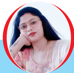
चित्रांश एक्सप्रेस डॉट इन

थक गए हम इस दुनिया की भीड़ में अपनों को ढूँढते ढूँढते, अपने ही गमों में कुछ यूँ मुस्कराते मुस्कराते। थक गए हम अब इन अपनों को अपना बनाते बनाते, अब अपने ही इन रूठों को मनाते मनाते। थक गए हम अब हमारी इन चाहतों को दफनाते दफनाते, सोचते है क्यों न अब थोड़ा सा आराम कर ले। इन रिश्तों नातों से अब थोड़ी सी दूरी कर ले, थक गए हम कब तक यकीन करे इन हाथों की लकीरों पर ? क्यों ना अब थोड़ा सा यकीन कर ले खुद पर। क्यों न सुधार करे अपने आप को, और इस जिंदगी को एक नया मोड़ दे।